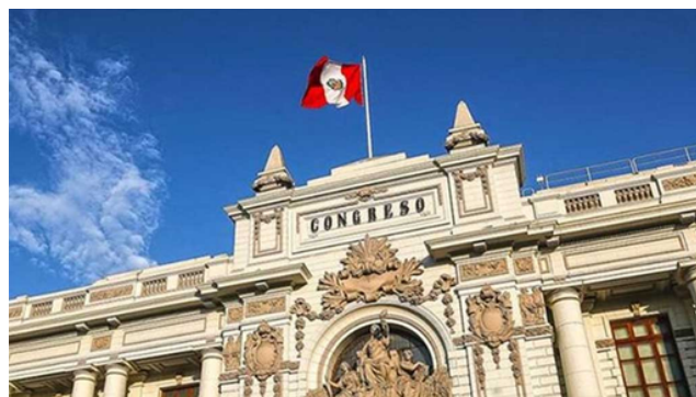
Der Kongress der Republik Peru ist das Parlament Perus.